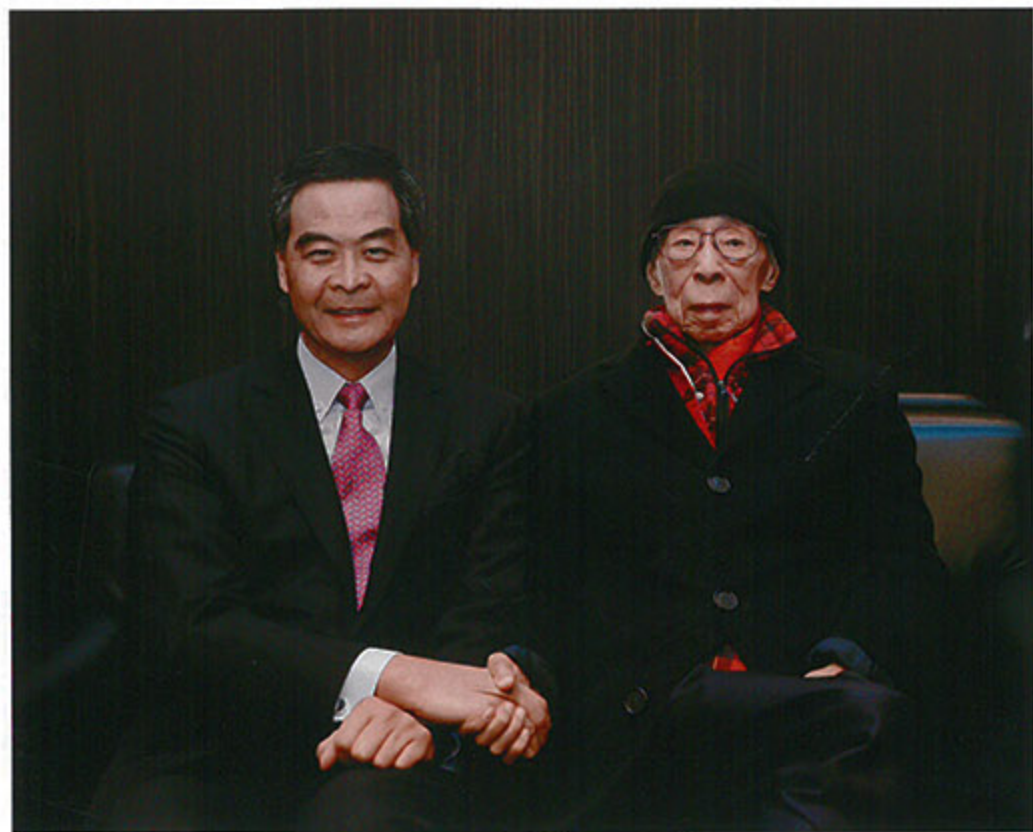
香港特别行政区行政长官梁振英 祝贺饶宗颐百岁寿诞

荣，学生、弟子遍布全球。饶宗颐教授博学多才，艺术上的造诣达到很高水准，在书画方面造诣尤深，山水、人物、花鸟兼能，各体书法无不精通，是集学问、艺术、才情于一身的当代名家。其学问、艺术与文化人格，为中国当代学术文化树立了一个经典的范式，这一范式所树立的标格，对于未来中国学术的发展方向具有重要的启示意义。