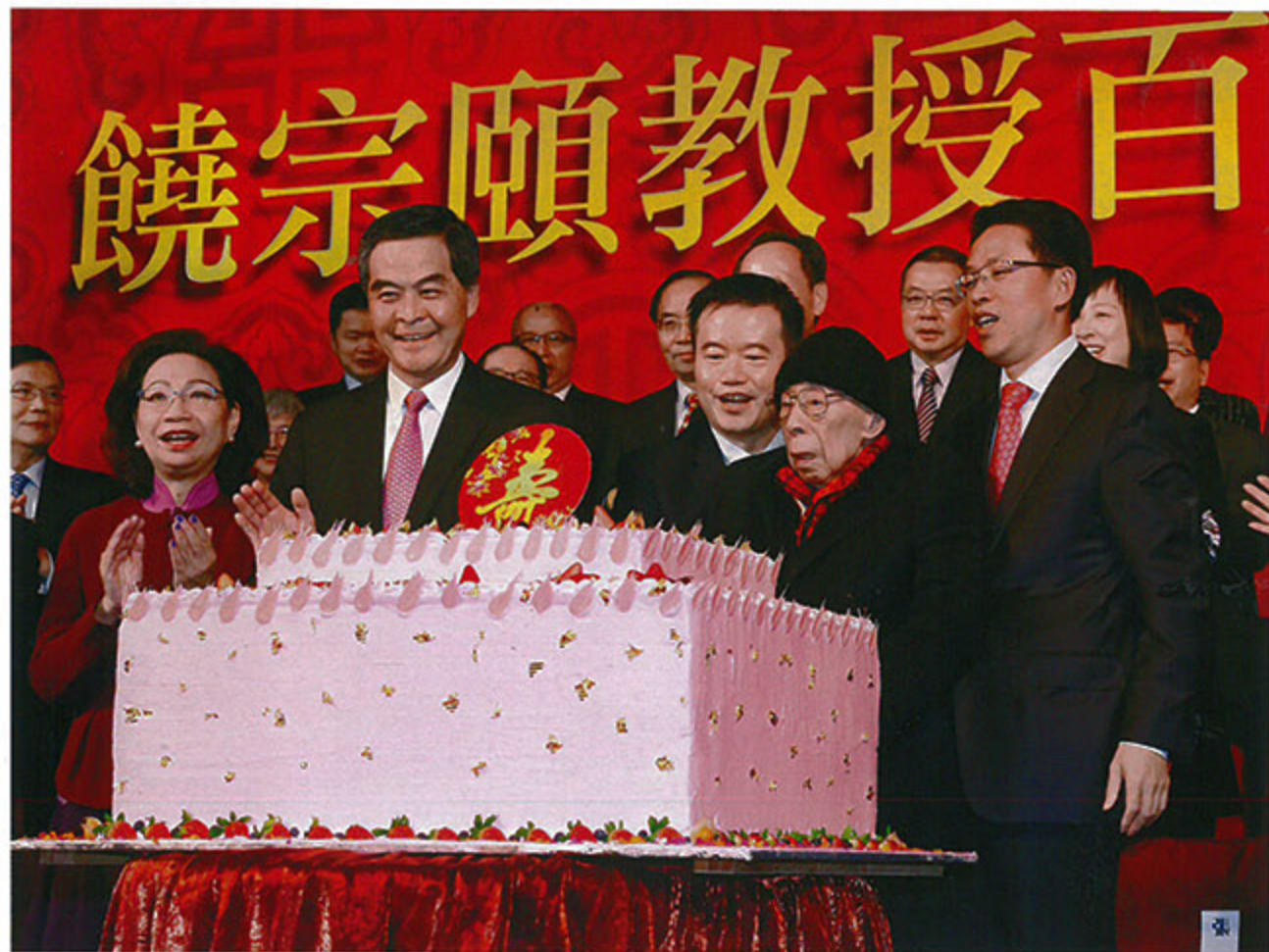
香港特别行政区行政长官梁振英、中央人民政府驻香港特别行政区联络办公室主任张晓明等嘉宾为饶宗颐庆贺寿诞