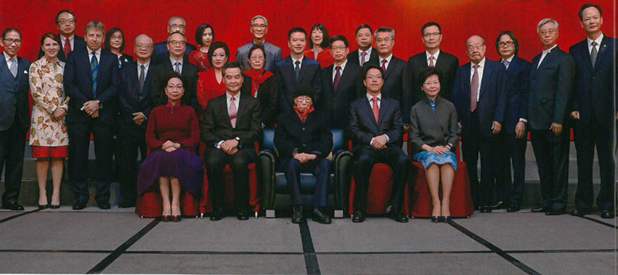
香港特别行政区行政长官梁振英及夫人梁唐青仪，中央人民政府驻香港特别行政区联络办公室主任张晓明，香港政务司司长林郑月娥以及香港各界嘉宾为饶宗颐教授庆祝百岁寿诞