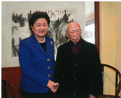
2009年12月6日，时任中共中央政治局委员、国务委员，现任中共中央政治局委员、国务院副总理刘延东在访港期间，来到香港大学饶宗颐学术馆探望国学大师饶宗颐。