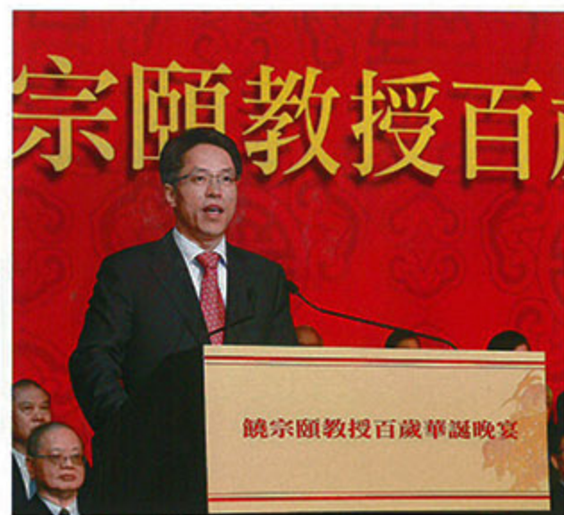
中央人民政府驻香港特别行政区联络办公室主任张晓明出席饶宗颐百岁华诞并致辞