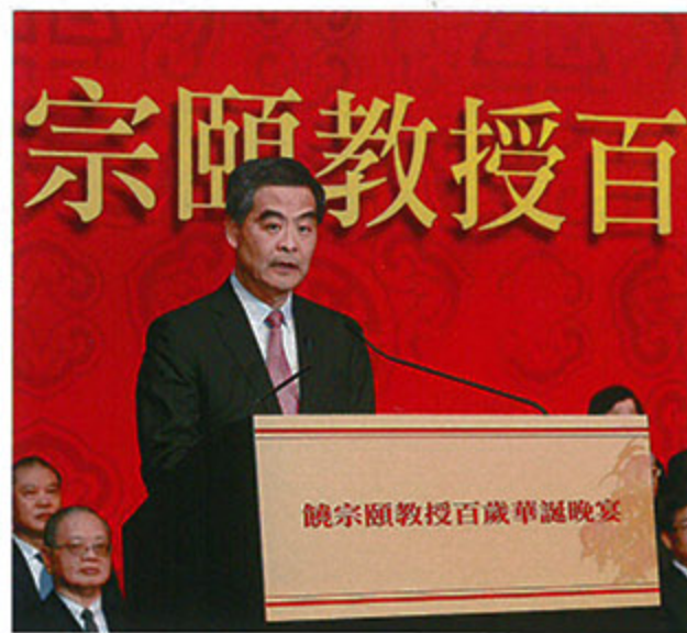
香港特别行政区行政长官梁振英出席饶宗颐百岁华诞并致辞

饶宗颐教授从事学术研究和教学工作超过八十年，学术研究领域非常广博。他是第一位讲述