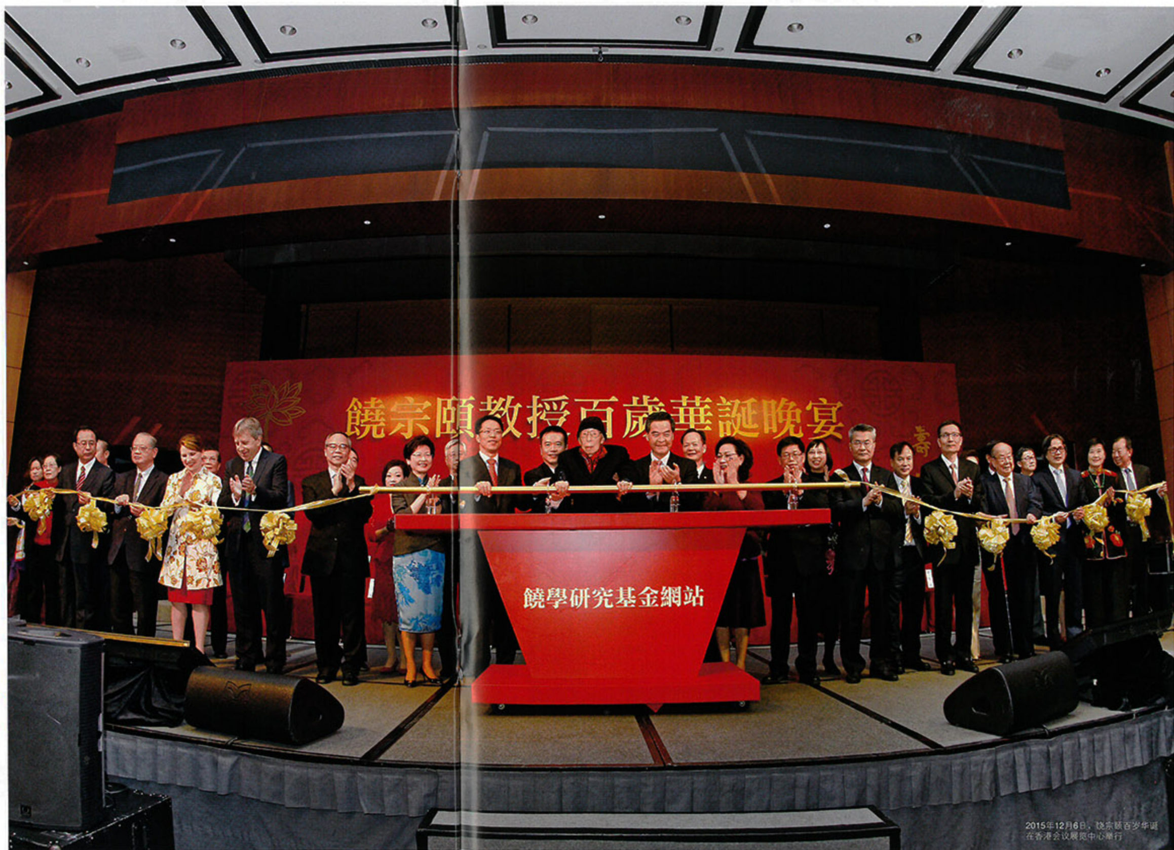
2015年12月6日，饶宗颐百岁华诞在香港会议展览中心举行

饶宗颐教授的研究几乎涵盖国学的所有领域，被学术界誉为“国际瞩目的汉学泰斗”、“整个亚洲文化的骄傲”。由于他精通内外经典，又有严格求实的治学态度，对人类古代文明能持客观的研究态度，他的许多学术著作在出版几十年后，仍然是国内外学界公认的权威著作，这使他在国内外学术界享有崇高的学术地位。他曾在香港大学、新加坡大学、美国耶鲁大学等国际知名学府任教，并屡获殊