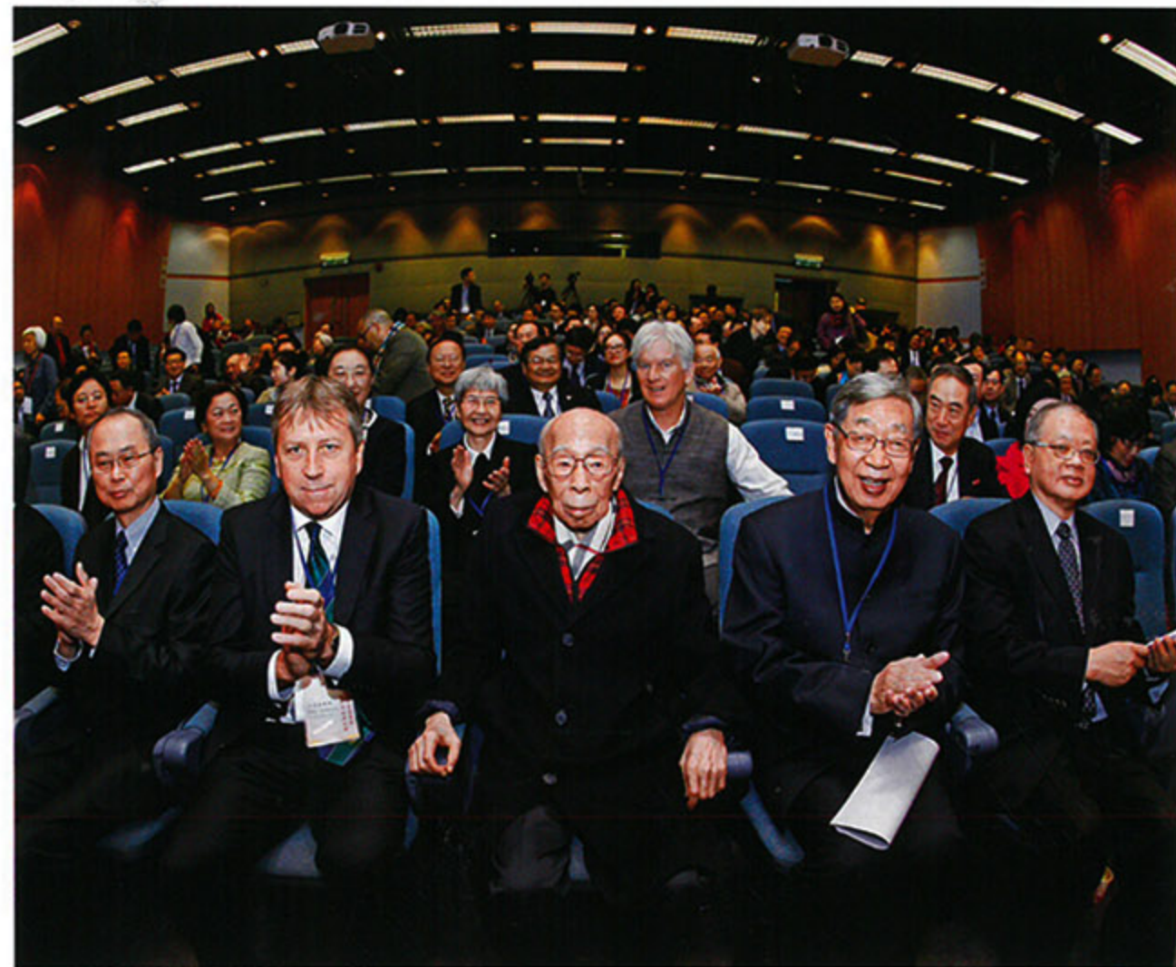
饶宗颐教授，第九届、第十届全国人大常委会副委员长许嘉璐，以及来自海内外的数百位专家学者出席开幕式