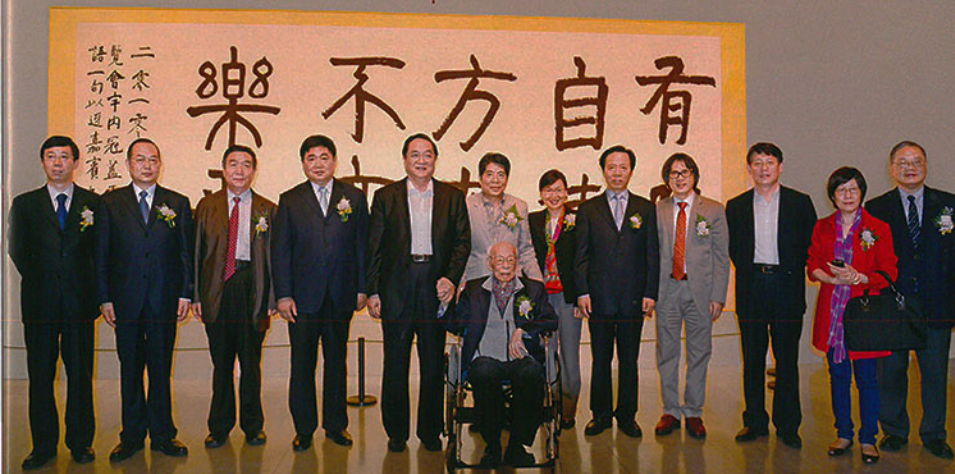
2012年6月28日，“海上四绝——饶宗颐教授上海书画展”在上海美术馆开幕。时任中共中央政治局委员、上海市委书记、现任中共中央政治局常委、全国政协主席俞正声观看书画，并亲切会见饶宗颐先生。

研究和教学工作超过八十年，学术研究领域非常广博。通晓英语、法语、日语、德语、梵文、古巴比伦文等多国语言文字，精通甲骨文和楚文，在甲骨学、敦煌学、楚辞学、古文字学、考古学、上古史、近东古史、艺术史、中外关系史、音乐、词学、经学、宗教学、文学、目录学、简帛学等多个学科领域均有重要贡献。他首次将敦煌写本《文心雕龙》公之于世，也是研究敦煌写卷书法的第一人；他是撰写宋、元琴史的首位学者，也精通古琴，善于诗赋，书画作品更是清逸飘洒，自成一家。饶宗颐足迹遍布五大洲，先后在新加坡大学、印度班达伽东方研究所、法国科研中心、法国远东学院、美国耶鲁大学研究院、日本京都大学、九州大学从事讲学或研究。学生、弟子遍布全球。2000年，饶宗颐获香港特区政府授予大紫勋勋章。2011年7月，国际天文联合会批准南京紫金山天文台发现的编号为10017的小行星命名为“饶宗颐星”。饶宗颐学贯中西，著作等身，为研究和弘扬中华文化作出了卓越贡献，虽年已百岁，仍然为国家文化建设以及香港与内地、中国与世界的人文交流建言献策、贡献力量。